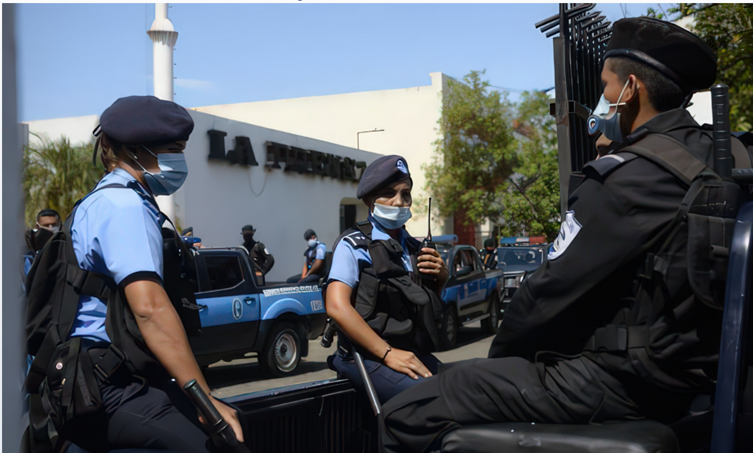
Patrullas de la policía de Nicaragua durante la toma de las instalaciones de La Prensa en agosto 2021.