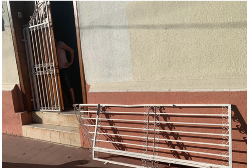
Policía de León rompe las puertas en la vivienda del periodista Aníbal Toruño