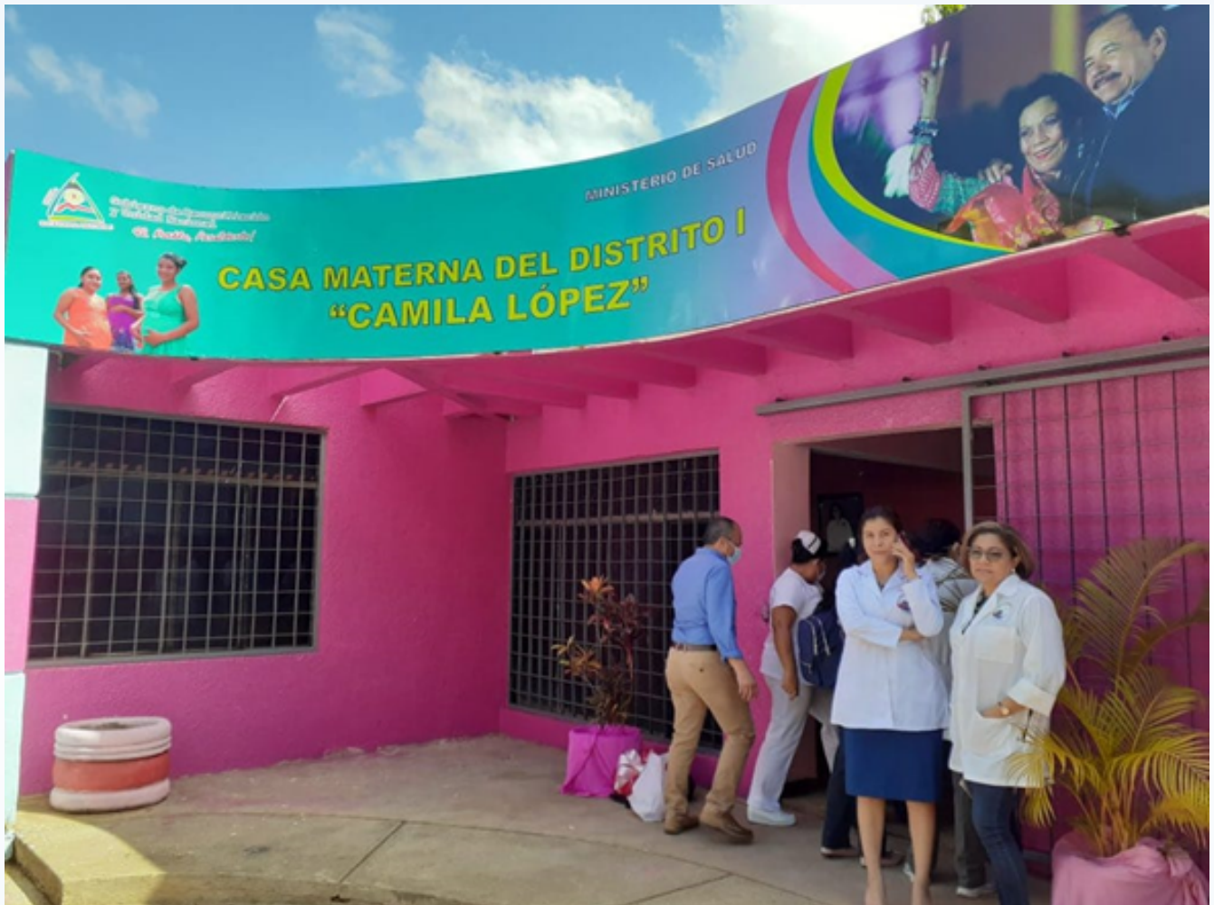
Gobierno inaugura casa materna en edificio confiscado a Confidencial