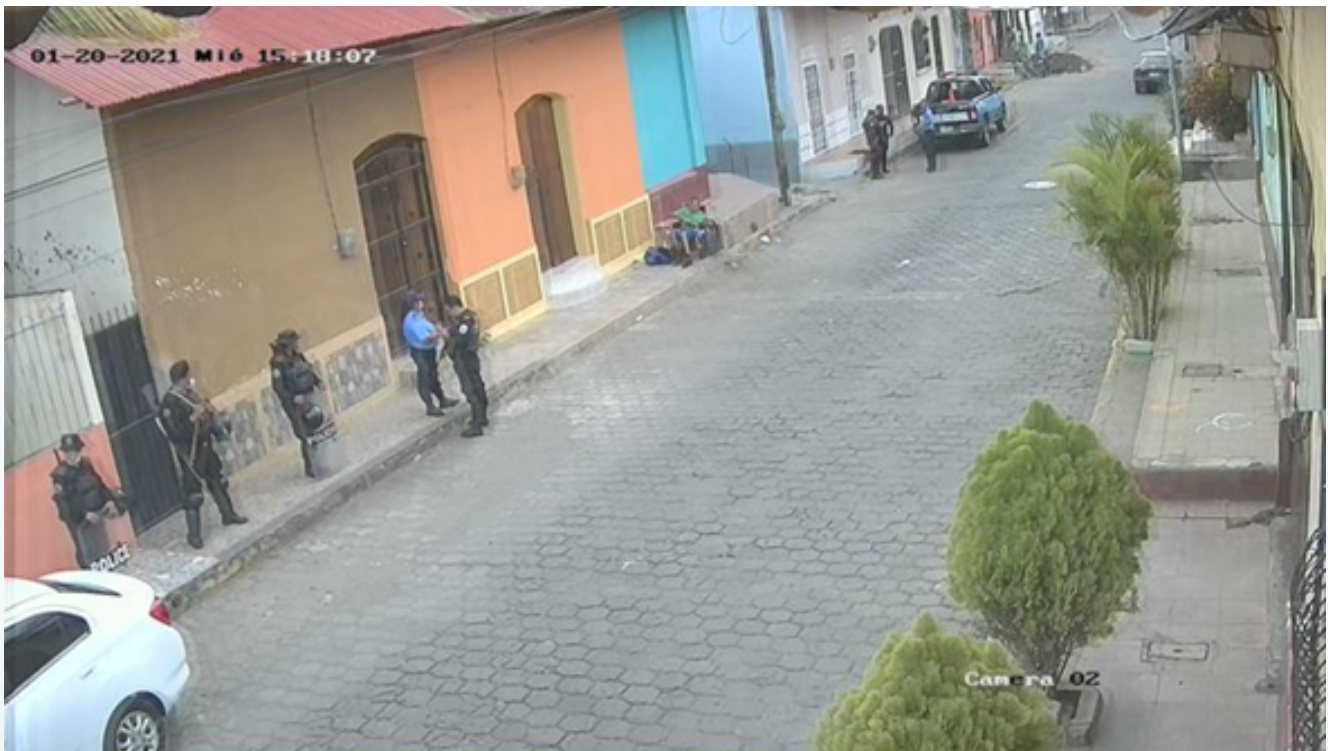
Efectivos de la Policía Nacional asedian las instalaciones de Radio Darío en León