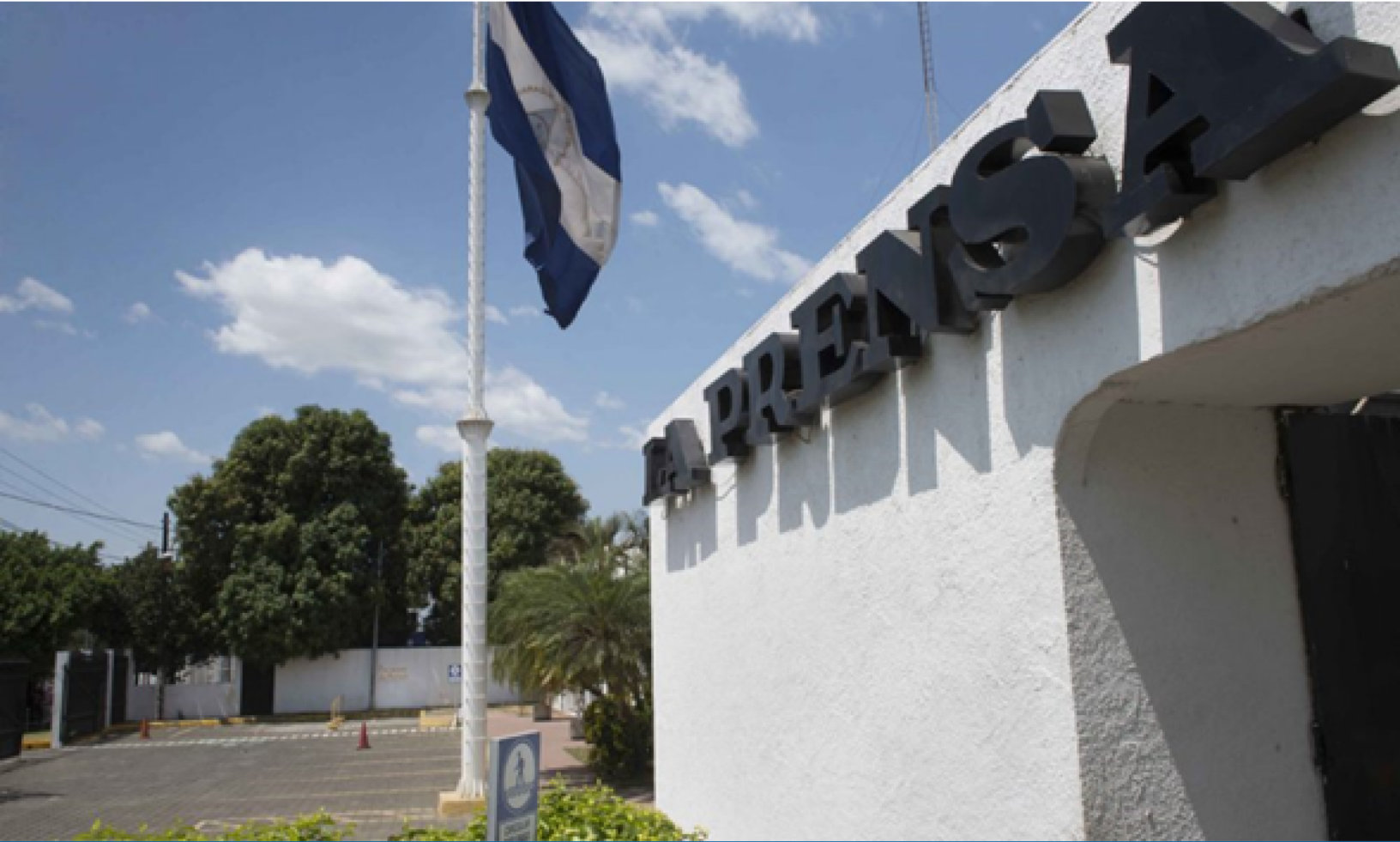
Instalaciones del Diario La Prensa